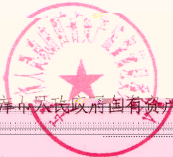
天津市人民政府国有资产监督管理委员会