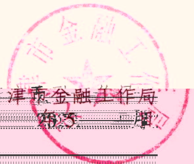
天津市金融工作局