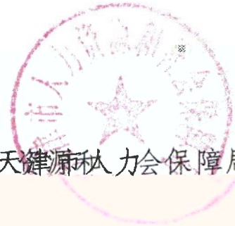
天津市人力资源和社会保障局